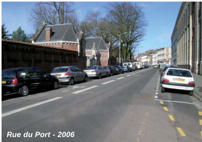
Rue du Port - 2006