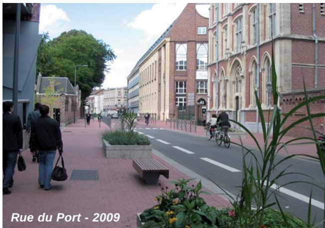
Rue du Port - 2009