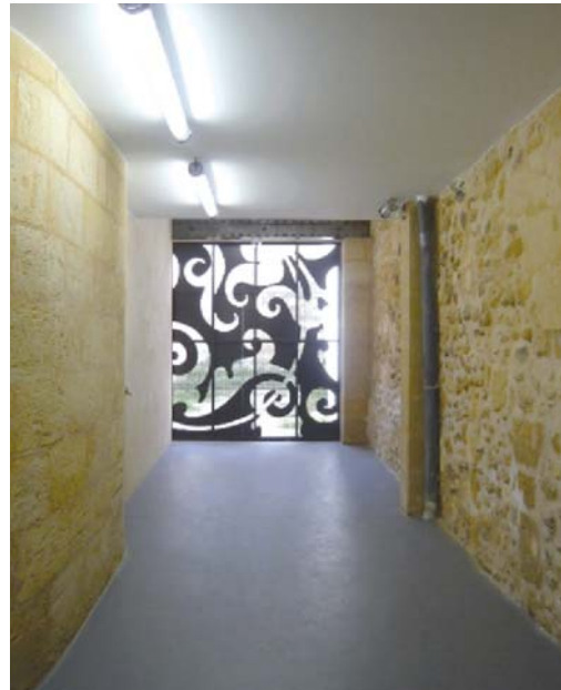
Local après les travaux

La devanture a été sécurisée et traitée de façon optimale tout en maintenant l'architecture inhérente au quartier, afin de permettre un usage confortable du local et la remise en valeur de façon contemporaine de l'arcade d'origine.