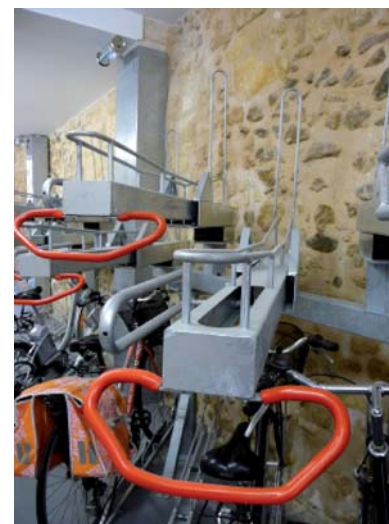
Un système de racks innovant