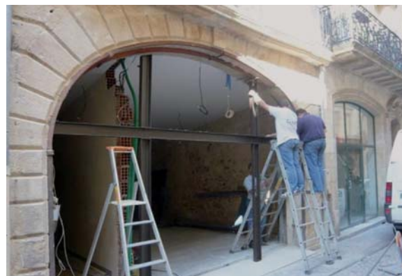
Réhabilitation de la façade