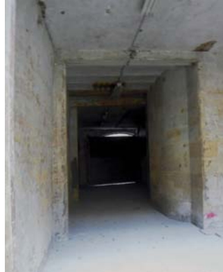
Local avant les travaux

Situé au 49, rue Bouquière, en rez-de-chaussée d'immeuble, à 30 mètres de la station de tramway « Porte de Bourgogne », ce nouveau local de 50 m 2 , refait à neuf et dédié, à l'abri des intempéries et des indécadences, offre 48 places de vélos, pouvant être stockés sur un système de racks innovant permettant d'optimiser l'espace.